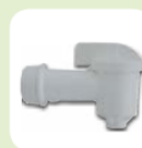
MQ 17 Rubinetto